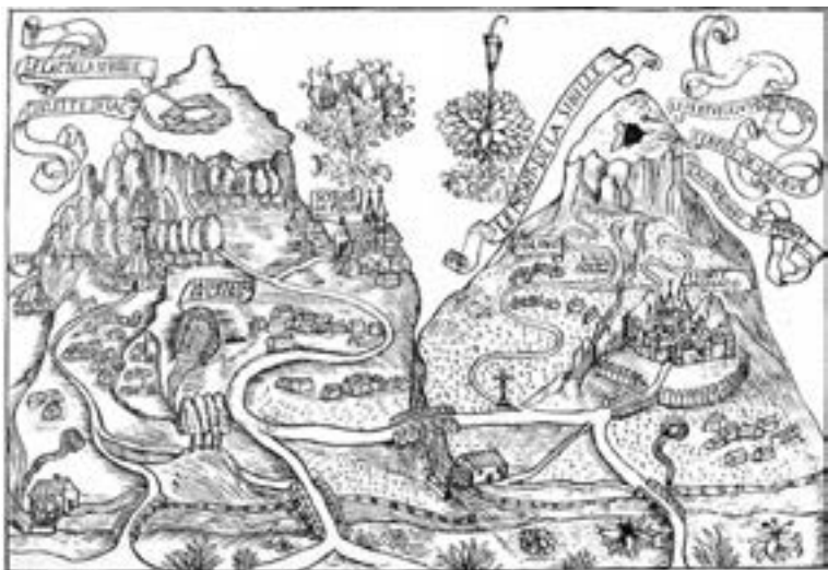
Fig. 3 - Le mont de la Sibille (Antonie de La Sale 1420).