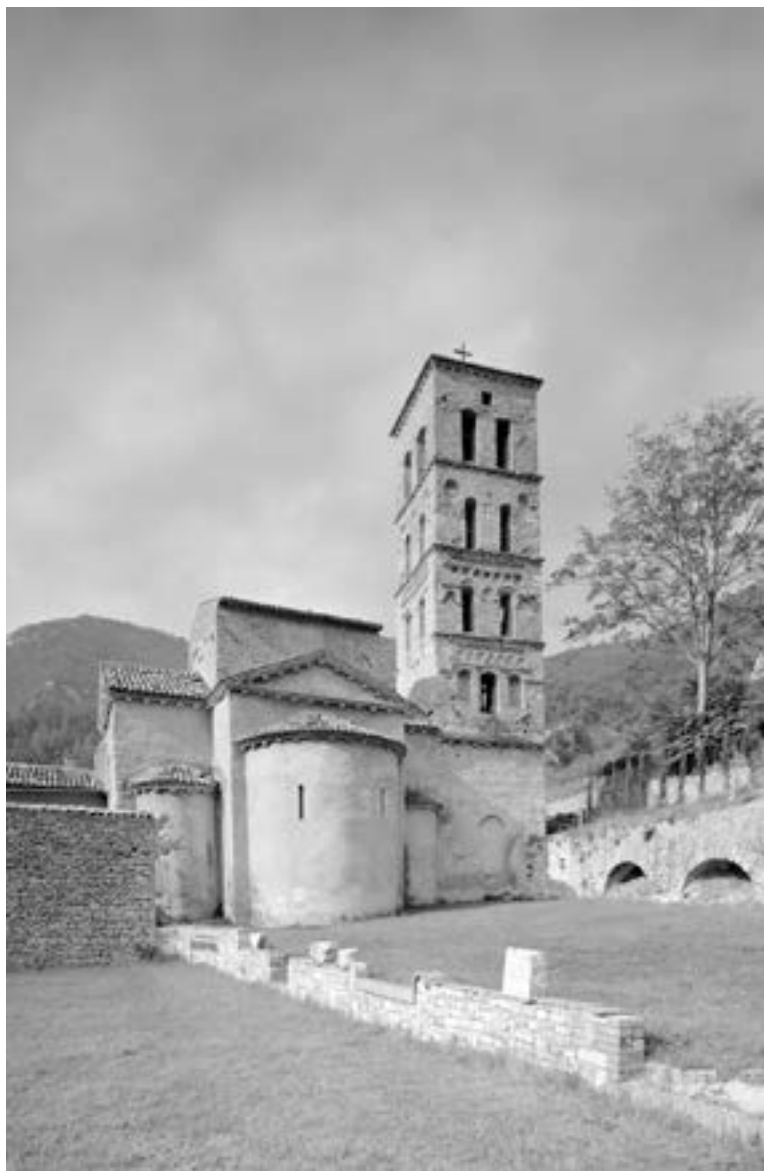
Fig. 11 - Abbazia di San Pietro, Ferentillo, 1967.