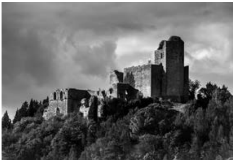
Fig. 4 - Rocca Albornoze, lago di Piediluco, Terni.