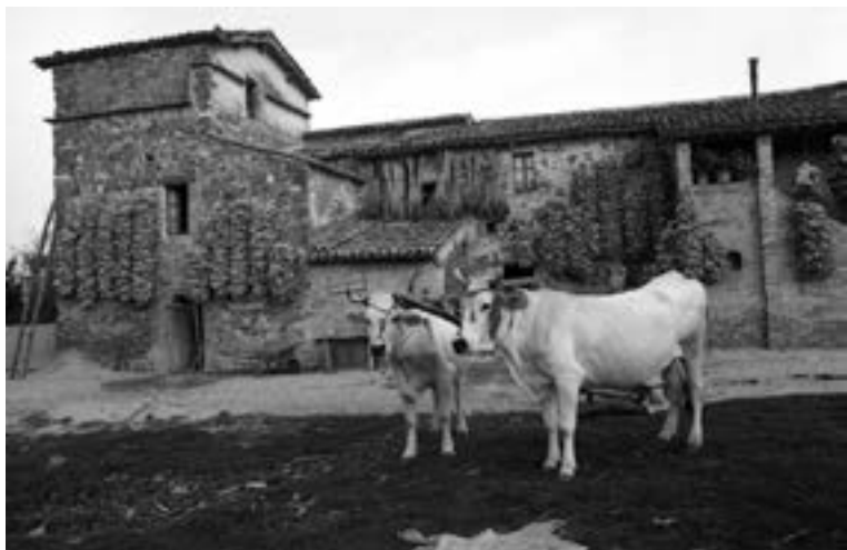
Fig. 12 - Casa colonica, Assisi, 1967.