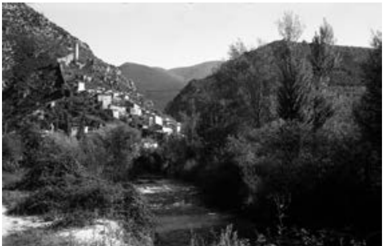
Fig. 8 - Ferentillo, 1967.