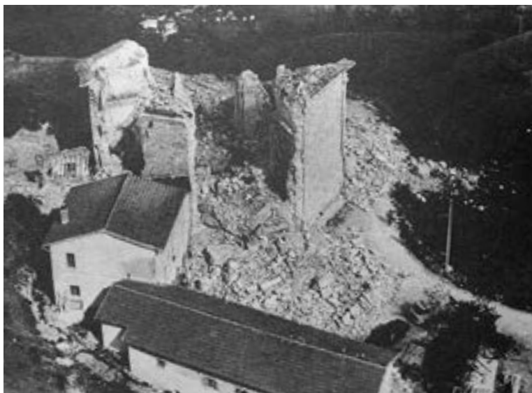
Fig. 16 - Castel Santa Maria, Cascia, Santuario della Madonna della Neve dopo il terremoto del 19 settembre 1979. (Guidoboni, Valensise, Il peso economico , p. 328)