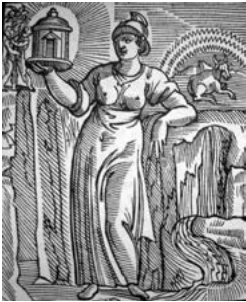
Fig. 7 - Umbria. (Cesare Ripa, Iconologia , p. 212)