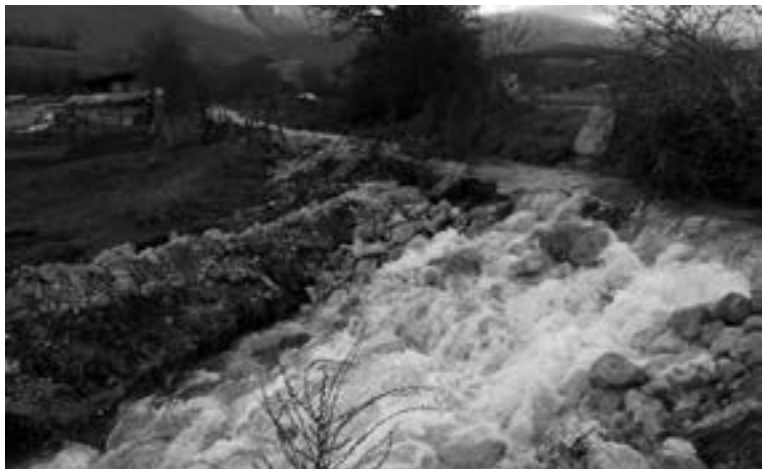
Fig. 17 - Torrente Torbidone, Norcia, 2016.