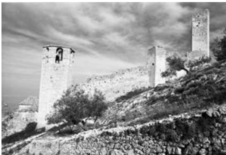
Fig. 13 - Campello sul Clitunno, 1967.