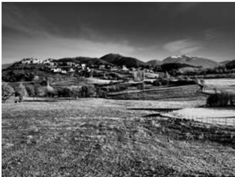
Fig. 5 - Cerreto di Spoleto.