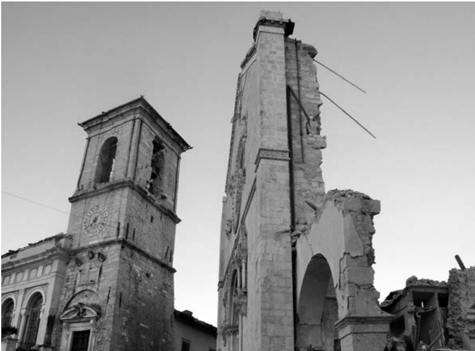
Fig. 2 - Torre del comune di Norcia e facciata della abbazia di San Benedetto, terremoto 2016.