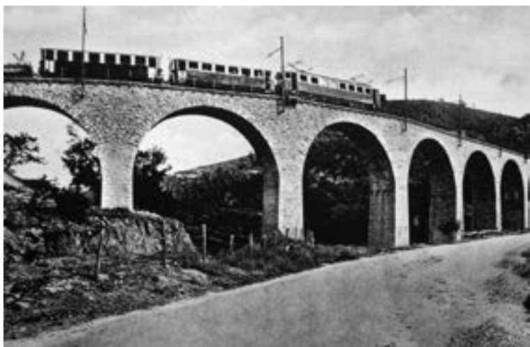
Fig. 10 - Ferrovia Spoleto-Norcia, incrocio Caprareccia.