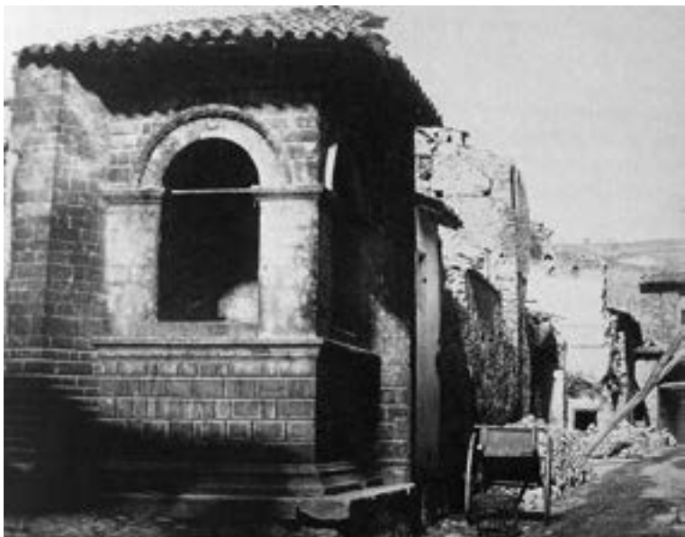
Fig. 14 - Terremoto di Norcia, 22 agosto 1859. (Guidoboni, Valensise, Il peso economico , p. 31)