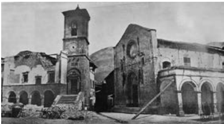
Fig. 15 - Comune e basilica di San Benedetto, Terremoto di Norcia, 22 agosto 1859. (Becchetti, Fotografi e fotografia , pp. 216-217)