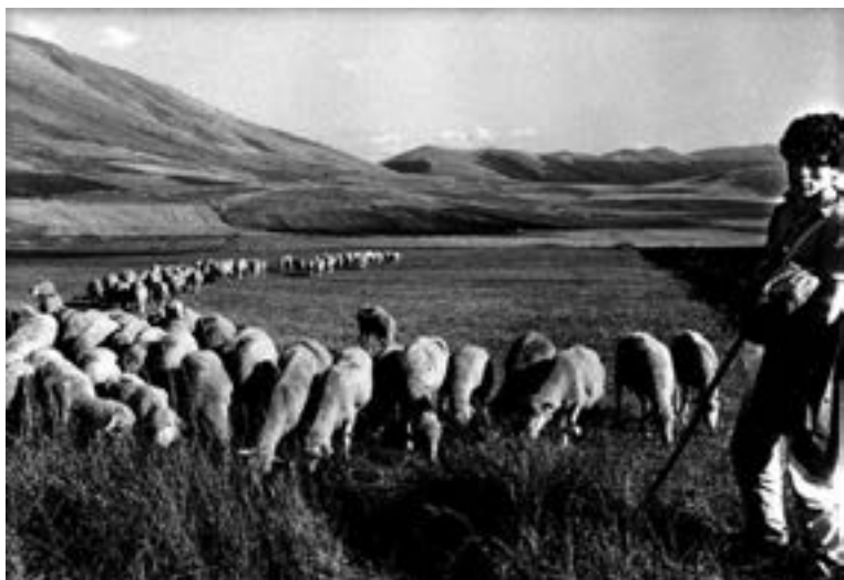
Fig. 9 - Pecore e pastori sul piano di Castelluccio, 1988.