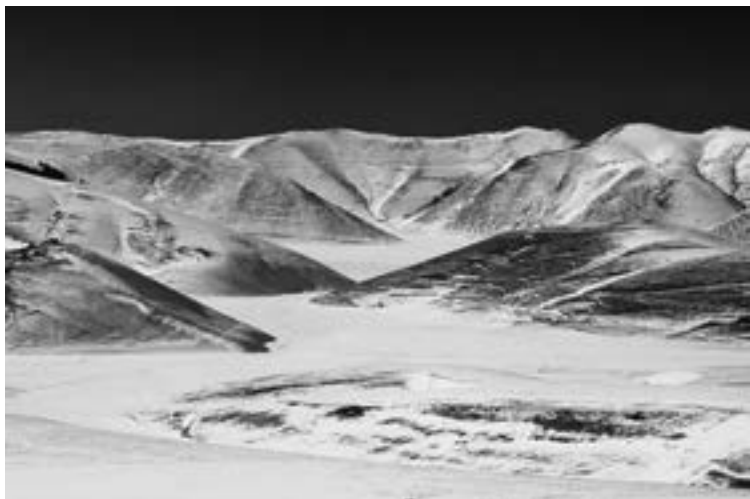
Fig. 6 - Piano di Castelluccio con il monte Vettore.